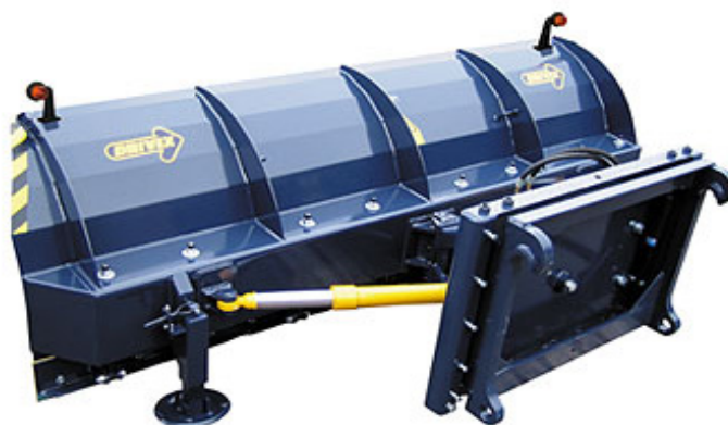
DB 320 HD