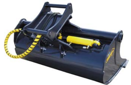
GPS 500 H